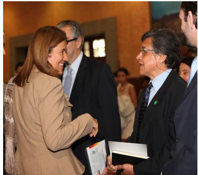
La Lic. Margarita Zavala conoce el trabajo de ALIENTO.