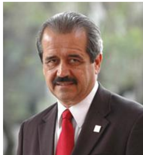
El Secretario de Salud ha señalado que aún debe subir más el precio de los cigarros

Ambas partes estuvimos de acuerdo en que faltan temas por cubrir en esos instrumentos jurídicos, principalmente la determinación para que los espacios públicos sean efectivamente 100% libres de humo de tabaco en el territorio nacional, la eliminación de cualquier forma de publicidad a los productos de tabaco, el aumento del tamaño de los pictogramas en las cajetillas de cigarros y la consolidación de los impuestos al tabaco.