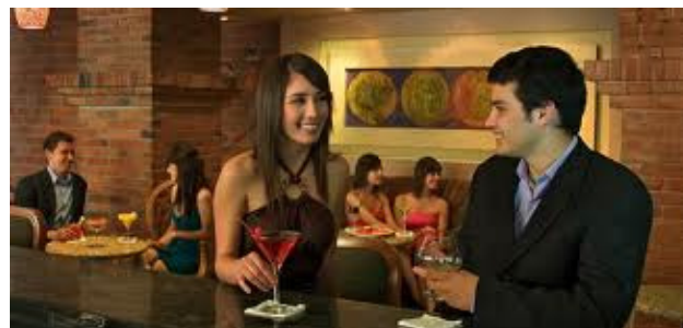
Restaurante de la ciudad de México.

Las organizaciones sociales expresamos a manera de conclusión que insistiremos en que las atribuciones regresen al INVEADF, ya que así estará la sociedad segura de que no habrá componendas entre malos servidores públicos y malos empresarios.