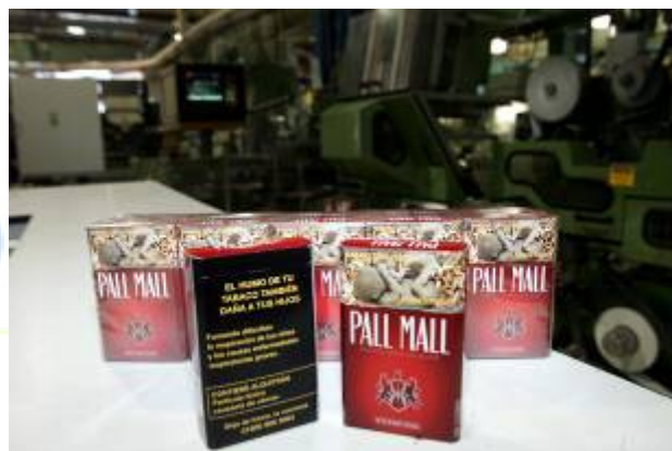
Cajetillas de cigarrillos con pictogramas

En 2011 cerraremos filas con más organizaciones sociales e instituciones públicas para incrementar las medidas de política pública y sus alcances, además de la concientizar a sectores significativos de la sociedad en torno a la urgente necesidad de reducir el consumo de tabaco en nuestro país que, asociado – no está de más repetirlo - con hasta 60 mil muertes al año”, señaló el Mtro. Erick Antonio Ochoa, Director de Iniciativas para el Control del Tabaco de la Fundación InterAmericana del Corazón - México.