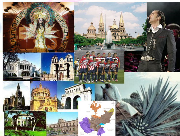
En Jalisco se llevan a cabo verificaciones para hacer cumplir la Ley General para el Control del Tabaco.

Después de casi tres años de haberse publicado la ley, la Comisión Federal para la Protección contra Riesgos Sanitarios (COFEPRIS) y la Secretaría de Salud federal (SSA) firmaron el Acuerdo que otorga a Jalisco la competencia necesaria para realizar sus propias revisiones y sanciones.