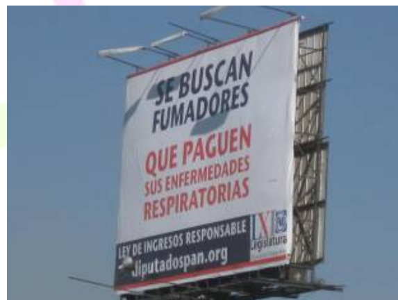
Uno de los anuncios colocados en el Estado de México.