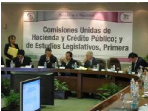
Sesión de la Comisión de Hacienda del Senado.