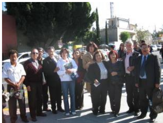
Pacientes de las clínicas contra el tabaquismo de Centros de Integración Juvenil y de la Facultad de Medicina de la UNAM.

Hombres y mujeres con diversas afecciones ocasionadas por fumar, intervinieron con gran convicción en las manifestaciones y visitas que los integrantes de la Fundación Interamericana del Corazón y de la Alianza Nacional para el Control del Tabaco (ALIENTO) hicimos en torno a la Cámara de Diputados para sensibilizar a los legisladores a efecto de que votaran por el incremento a los impuestos al tabaco, justamente para que el Estado cuente con mayores recursos para atender las enfermedades asociadas al consumo de tabaco.