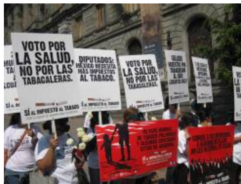
Activistas ante la Cámara de Senadores.