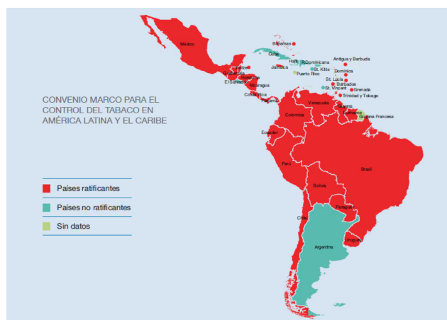
Implementación del CMCT en América Latina.

Este documento es un diagnóstico básico para que, tanto los gobiernos de América Latina y el Caribe como las diferentes organizaciones sociales, elaboren estrategias urgentes para lograr una acción eficaz que salve la vida de miles de personas en toda la región.