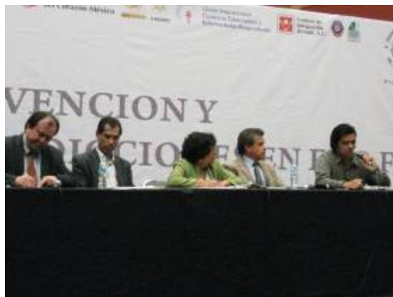
Especialistas, legisladores y responsables de centros de atención discutieron diversos temas sobre el consumo de drogas.

Los dos primeros foros se realizaron exitosamente el 27 de octubre y el 3 de noviembre, en el Museo de la Ciudad de México ante numerosas audiencias de especialistas, profesionales de distintas ramas, miembros de grupos de ayuda mutua y personal de salud.