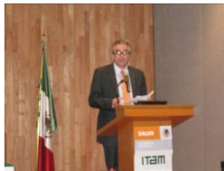
Dr. Mauricio Hernández Ávila.

De acuerdo a la Encuesta Nacional de Adicciones, diversas medidas emprendidas como la promulgación de la Ley General para el Control del Tabaco, han impactado de manera positiva al reportar una reducción en los adultos fumadores de 10 puntos porcentuales.