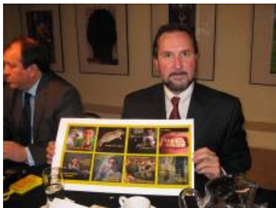
Dr. James Trasher, investigador del Instituto Nacional de Salud Pública (INSP) y asesor de CODICE.

Si bien se trata de una serie de ocho imágenes y sus correspondientes mensajes que informan de manera explícita sobre las mortales sustancias que contiene un cigarrillo (como el cianuro y el amoníaco) la experiencia internacional muestra que incluir imágenes más fuertes de los daños a la salud por el consumo de tabaco, logra mejores resultados en los fumadores para sensibilizarlos y abatir el consumo. Por lo tanto, aunque las imágenes mexicanas al ser la primera serie causarán impacto en la población, es necesario contemplar en una segunda ronda fotografías más contundentes.