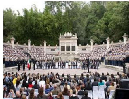
Toma de protesta de los verificadores.

Una magnífica noticia para la preservación de la capital del país como la ciudad más poblada del mundo que ha sido declarada libre de humo de tabaco, es el inicio de operaciones del Instituto de Verificación Administrativa del D. F. (INVEADF), dotado de 289 verificadores, quienes a partir del 3 de septiembre vigilarán el cumplimiento de la Ley de Protección a la Salud de los No Fumadores en el D. F. (LPSNFDF).